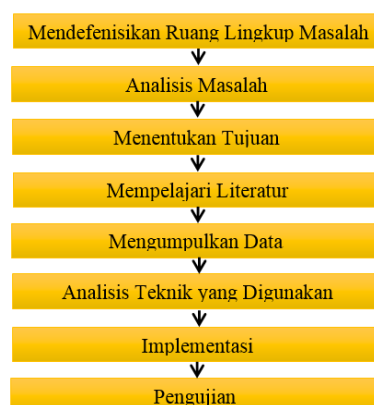
Gambar 1. Kerangka Penelitian

Pada bagian ini akan diuraikan kerangka penelitian, kerangka ini merupakan langkah-langkah yang akan dilakukan dalam penyelesaian masalah yang akan dibahas.