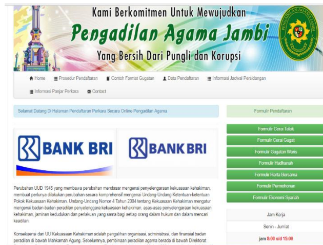
Gambar 3 Rancangan Menu Utama

Rancangan user interface yang akan menjadi gambaran kedepan dalam membuat prototype . Adapun rancangan interface sebagai berikut :