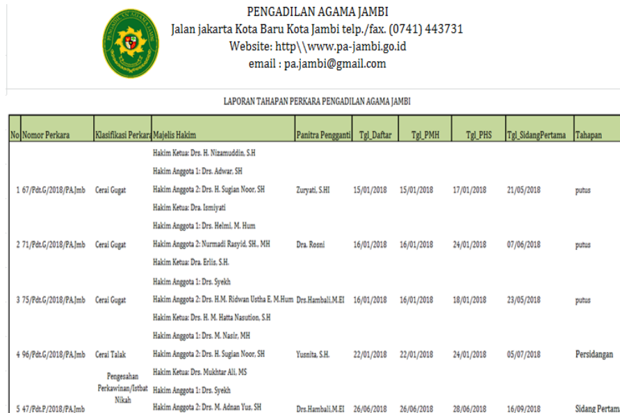
Gambar 8 Rancangan Output Laporan Tahapan Perkara

Rancangan output laporan tahapan perkara adalah laporan untuk mengetahui sampai mana proses penyelesaian perkara tersebut. Berikut tampilan rancangan output laporan penilaian yang dapat dilihat pada gambar 8.