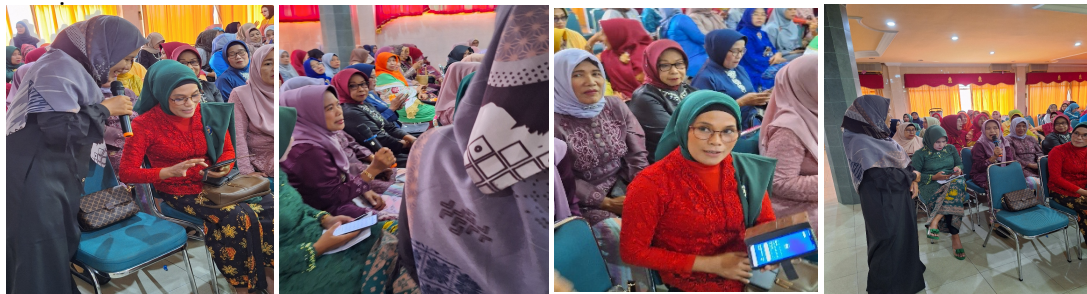
Gambar 4. Praktik Aplikasi