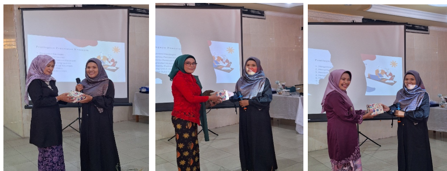
Gambar 5. Pemberian Merchandise Kepada Peserta