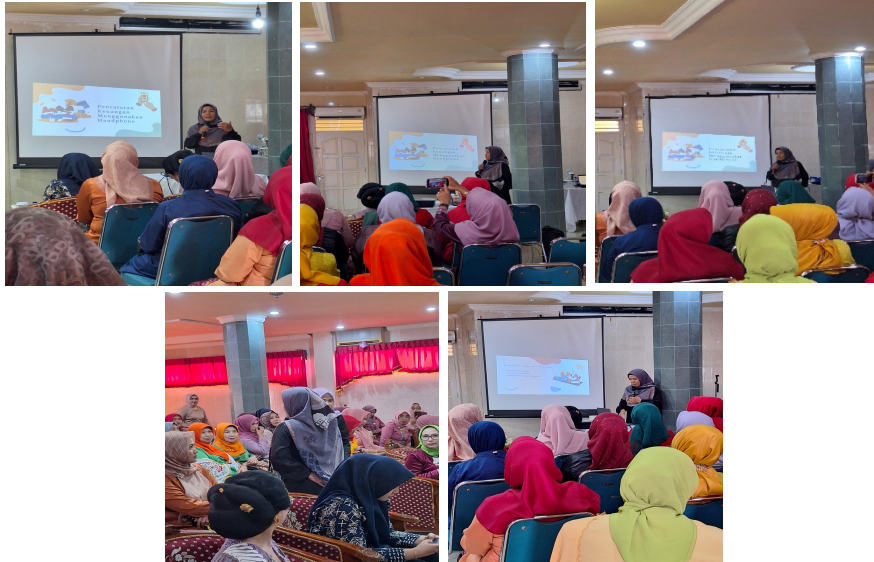
Gambar 3. Pemaparan Materi