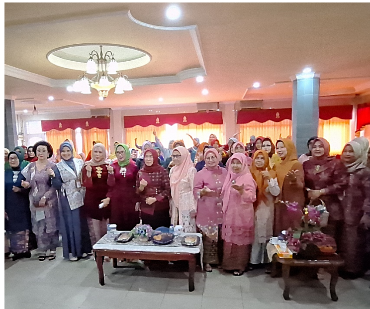
Gambar 6. Foto Bersama Anggota IWAPI DPD Kota Jambi

Kegiatan dimulai dengan sesi penyampaian materi yang disampaikan oleh narasumber. Dalam sesi ini, peserta diberikan pemahaman mengenai pentingnya pencatatan keuangan dan cara penggunaan aplikasi berbasis Android untuk mendukung pengelolaan usaha. Setelah itu, peserta diarahkan untuk melakukan praktik langsung penggunaan aplikasi di HP masing-masing.