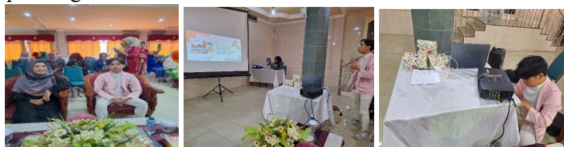
Gambar 2. Persipan Kegiatan