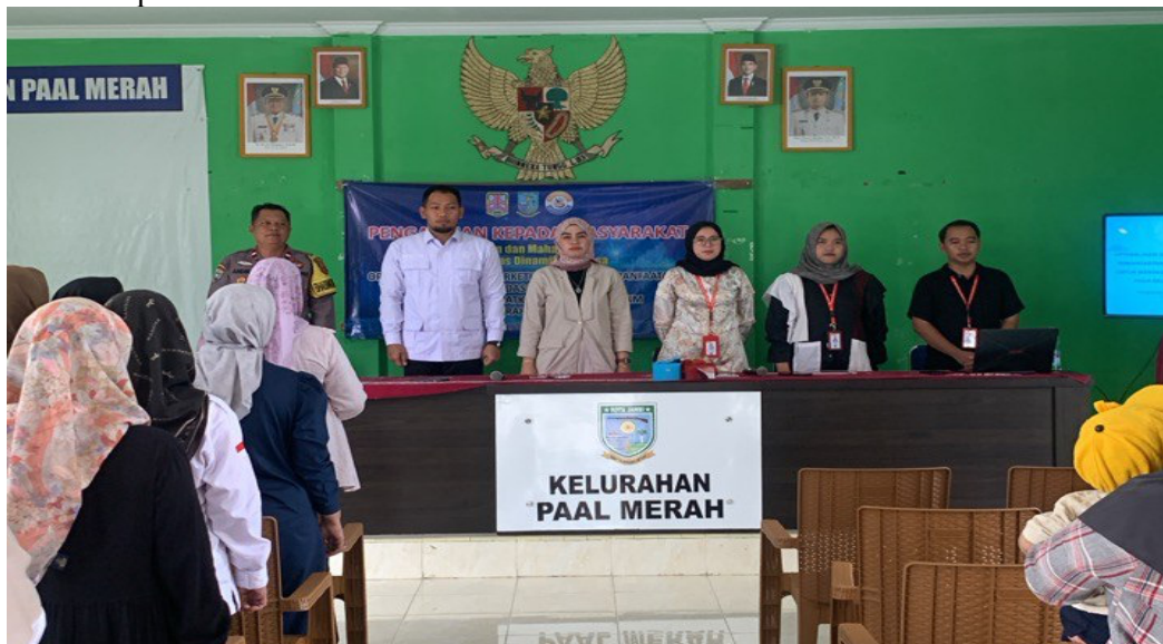
Gambar 1. Pembukaan dan Menyanyikan lagu Kebangsaan Indonesia raya

Pelaksanaan Kegiatan di mulai dengan Pembukaan dengan memperkenalkan masing masing anggota tim pelaksana dan penyampaian maksud serta tujuan yang di lakukan oleh moderator, kemudian menyanyikan lagu kebangsaan Indonesia raya dan penyampaian kata sambutan yang di lakukan oleh Kepala Lurah PaalMerah Kota Jambi.