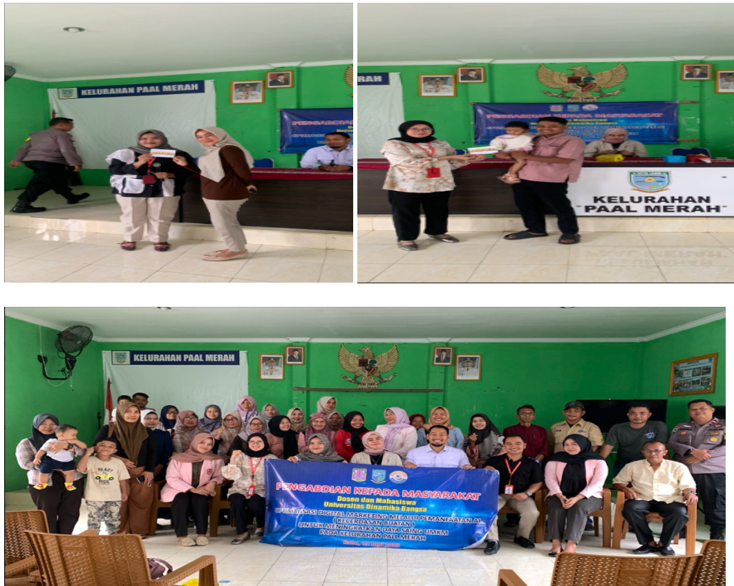
Gambar 3. Pemberian Hadiah dan Foto bersama

Setelah posttest berakhir maka akan di umumkan pemenang dari sesi tanya jawab dan juga dari sesi posttest, kemudian di lanjutkan dengan pemberian konsumsi dan di tutup dengan sesi foto bersama.