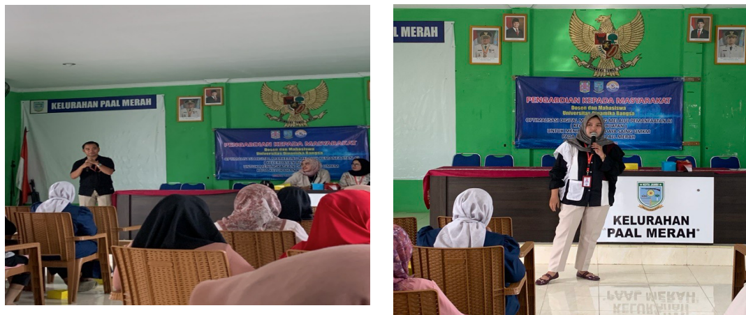
Gambar 2. Penyampaian materi oleh Instruktur

Setelah di lakukan pretest kemudian akan dilakukan penyampaian materi yang di lakukan oleh Instruktur.