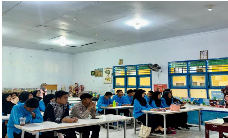
Gambar 5 . Foto Pelatihan oleh tim narasumber