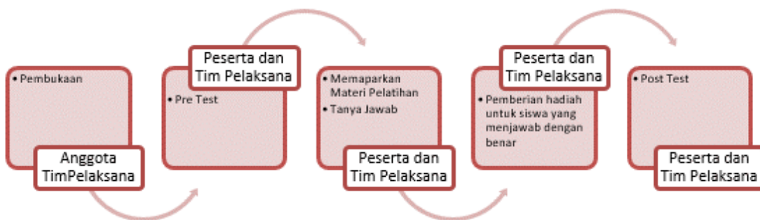
Gambar 1. Deskripsi Kegiatan

Kegiatan Pelatihan Digital Marketing Dalam Meningkatkan Kompetensi Siswa Untuk Berwirausaha Pada SMA Negeri 8 Kota Jambi bertujuan untuk memberikan pengetahuan dan wawasan kepada siswa siswi sekolah menengah atas untuk dapat menghadapi dunia kerja dan persiapan memasuki perguruan tinggi dengan memberikan pelatihan digital marketing agar dapat membuka peluang usaha untuk berwirausaha, kegiatan ini merupakan bagian dari pengabdian kepada masyarakat oleh dosen yang dikelola LPPM Universitas Dinamika Bangsa. Kegiatan pengabdian kepada masyarakat ini dilaksanakan pada hari Jumat Tanggal 26 Juli 2024. Pelaksanaan kegiatan ini diawali dengan pre test, kemudian instruktur/penyuluh memberikan penjelasan tentang materi pelatihan, diskusi dan tanya jawab yang berhubungan dengan materi yang sesuai dengan judul kegiatan, dan diakhiri dengan post test. Pelaksanaan kegiatan pengabdian masyarakat ini diikuti oleh 25 orang peserta yang merupakan siswa siswi pada SMA Negeri 8 Kota Jambi. Metode pelatihan dilakukan dengan pre test terlebih dahulu kemudian penyampaian materi melalui LCD Projector, tanya jawab dan pemberian doorprize untuk siswa siswi yang bisa menjawab pertanyaan dengan benar. Diakhir pelatihan dilaksanakan post test untuk melihat tingkat pemahaman siswa siswi dari pelatihan yang diberikan.