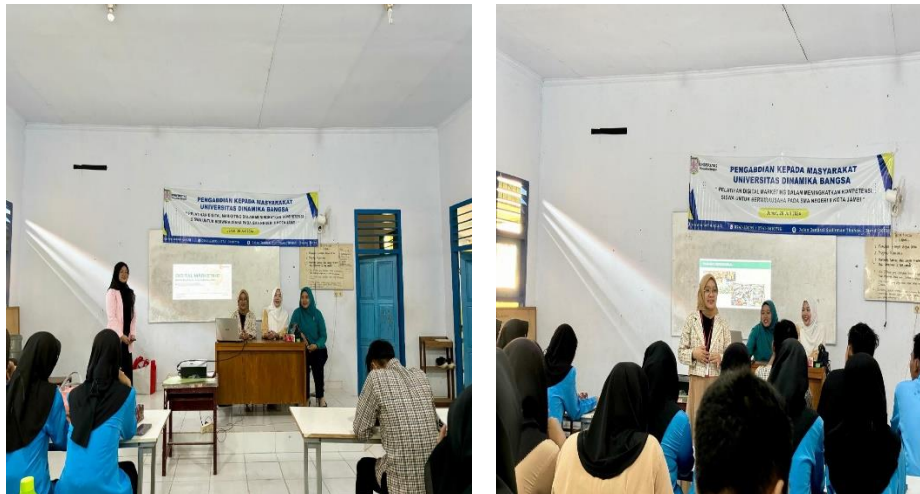
Gambar 6 Foto peserta mengikuti kegiatan pelatihan