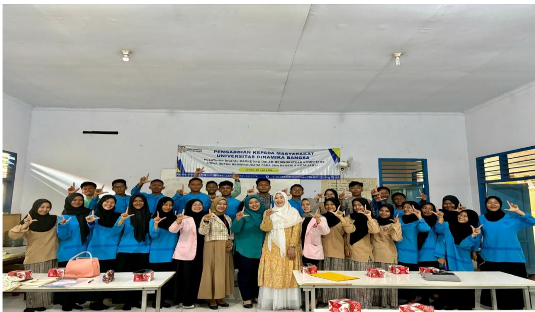
Gambar 4. Sesi Foto Bersama dengan tim narasumber