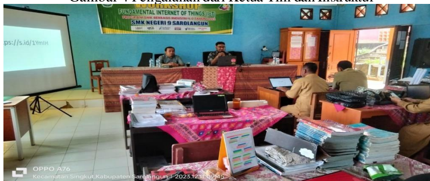
Gambar 5 Suasana Ruangn Kegiatan PKM