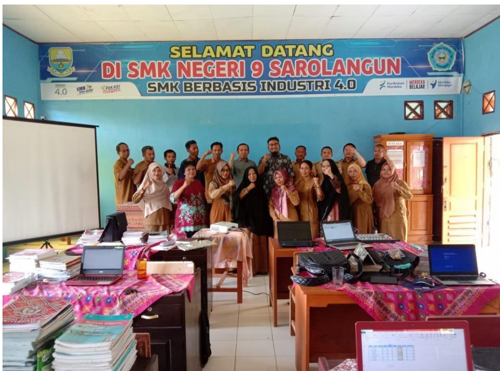
Gambar 7 Foto Bersama Peserta dan Kepala Sekolah SMK N 9 Singkut