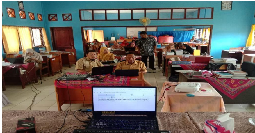
Gambar 6 instruktur menyapa peserta pelatihan