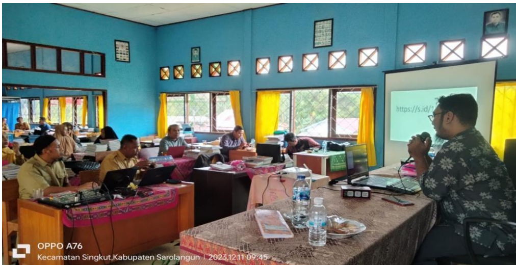
Gambar 4 Pengarahan dari Ketua Tim dan Instruktur

Didalam kegiatan pelatihan ini terdapat dokumentasi antusias peserta dalam mengikuti pelatihan. Berikut ini adalah dokumentasi peserta pelatihan: