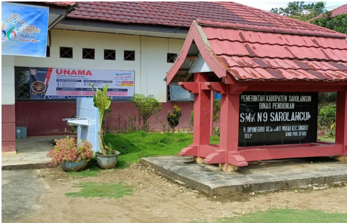
Gambar 1. SMK Negeri 9 Singkut Sarolangun Jambi